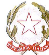
Ministero dello Sviluppo Economico