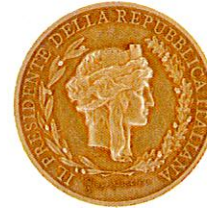
PRESIDENTE DELLA REPUBBLICA